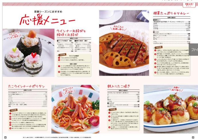
季節のテーマごとに展開するレシピページ