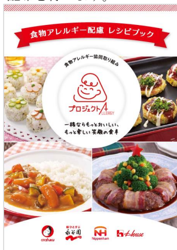
レシピブック表紙