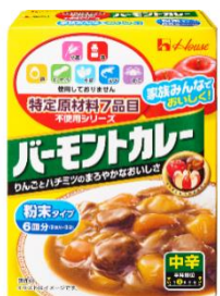
【特定原材料7品目不使用シリーズ】