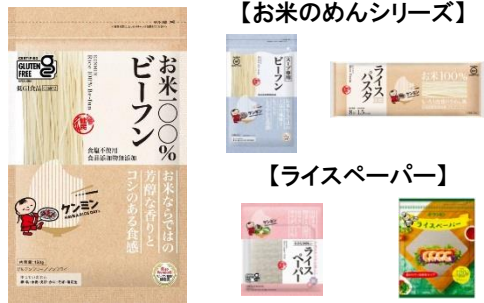
【お米のめんシリーズ】