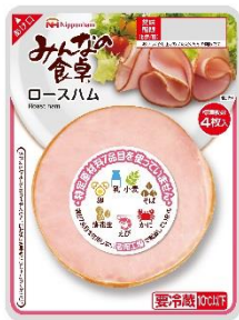
【みんなの食卓シリーズ】