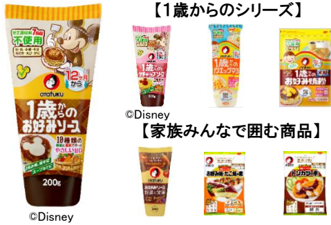
【1歳からのシリーズ】